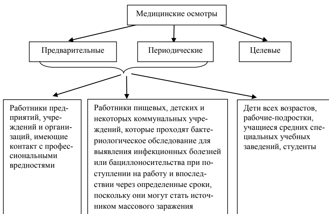
Рис. 2. Виды подразделений медицинских осмотров

Одним из важнейших методологических подходов при изучении здоровья населения для профилактики возникновения заболеваний является периодическое проведение профилактических медицинских осмотров. Классификация их по видам и контингенту осматриваемых лиц представлена на рис. 2.