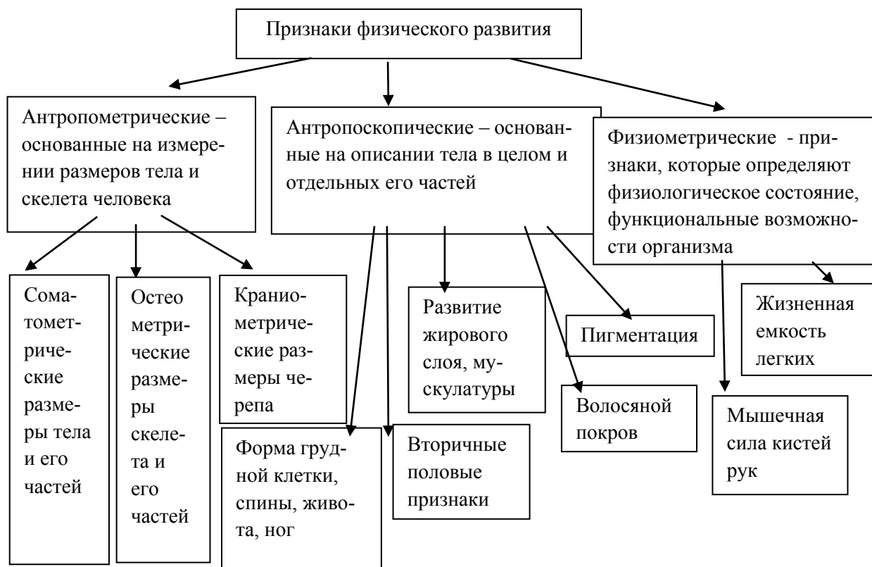
Рис. 3. Основные признаки физического развития

Измерение длины тела. Проводится с помощью ростомера. Испытуемый должен встать на платформу ростомера, касаясь вертикальной стойки пятками, ягодицами, межлопаточной областью и затылком. Экспериментатор измеряет рост испытуемого. Полученный результат зафиксировать.